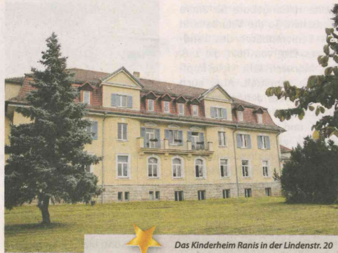
Das Kinderheim Ranis in der Lindenstr. 20

Uhr. So nach und nach trudeln die Bewohner aus Schule und Kindergarten ein. Die Schulkinder und Jugendlichen haben erstmal Hausaufgabenzeit – nicht gerade einfach, wenn die Luft nach einer Schulwoche eigentlich erstmal raus ist. Doch die Pädagogen wissen zu motivieren: „Dann ist es geschafft und du musst das ganze Wochenende nicht mehr daran denken.“ Am Wochenende stehen für die, die nicht in ihre